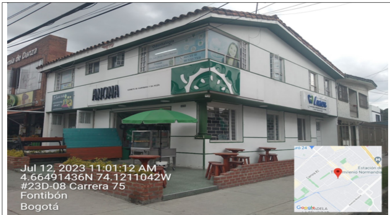
Vista panorámica del predio en el que se sitúa el establecimiento de comercio denominado ANONA , el cual cuenta con fachada con orientación visual hacia la CR 75 y fachada con orientación visual hacia la CL 23 D.