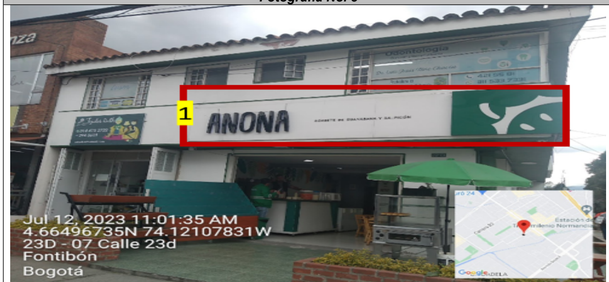
En la fachada con orientación visual hacia la CR 75, se puede evidenciar: UN (1) elemento publicitario tipo “aviso en fachada” instalado sin contar con el registro ante la Secretaría Distrital de Ambiente, identificado con el número 1.