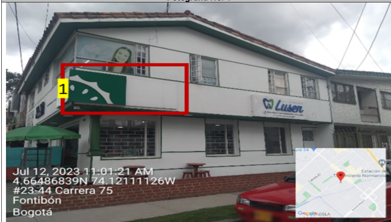
Fotografía No. 4

En la fachada con orientación visual hacia la CL 23 D, se puede evidenciar: UN (1) elemento publicitario tipo “aviso en fachada” instalado sin contar con el registro ante la Secretaría Distrital de Ambiente, identificado con el número 1.